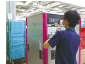
温度管理を行い接種会場へ 新型コロナワクチンを配送

全国の自治体と医薬品供給の協定を結び、災害時における医薬品の安定供給を担っています。また国からの要請により、地域担当卸として新型コロナワクチンの配送を行っています。その他にも高齢者の見守り協定などを締結し、地域に貢献しています。