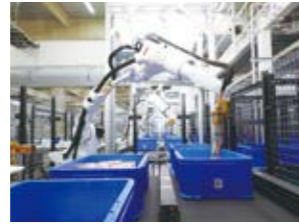
ピッキング自動化で誤配送をなくす ピースピッキングロボット

医薬品の安定供給を実現するために、AI、ロボット、ドローンなどを活用し、医薬流通を効率化する様々な実証実験を進めています。医薬品卸が持つ医薬流通に関する様々な知見と、デジタル技術活用のノウハウを掛け合わせて医薬流通のDXに取り組んでいます。