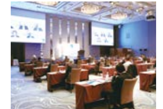
IFPW(国際医薬品卸連盟) 東京総会

世界約20か国の医薬品卸団体及び卸企業などで構成するIFPW東京総会を、オンライン/リアルのハイブリッド方式で初開催。高齢社会に対応する日本の医療制度等を取り上げ、各国の医薬品市場や医薬品卸の取り組みなどについて議論しました。