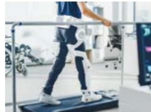
機能改善用装着ロボットスーツ

再生医療ベンチャーやロボットベンチャーへの積極的な出資を行っています。これにより、患者さんの治療に新たな選択肢を提供するとともに、サイバニクス治療による機能改善、自立支援の普及も支援していきます。