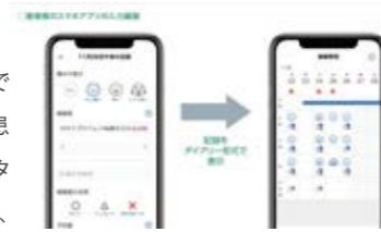
スマートフォンアプリを使った 疾患管理プログラム

患者さんの症状の変化を記録し、医師との間で共有する方法として、デジタル技術を活用した疾患管理が近年注目を集めています。医薬品卸はデータヘルスアプリの開発や医療機関のDX支援を通して、患者さんと医療機関をつなぎ、双方の課題解決に貢献していきます。