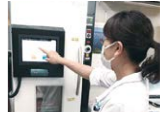
保険薬局に設置された低温保管庫

再生医療等製品などのスペシャリティ医薬品は、発症後短時間での投与が必要な製品や使用期限が短い製品も多く、サプライチェーンを通して超低温環境の維持やトレーサビリティの確保が必要です。そこで、スペシャリティ医薬品を安心・安全に保管・輸送できる物流システムを構築しています。