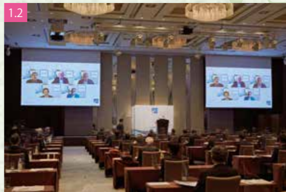
1.2 IQVIAによる世界医薬品卸の業界レビュー