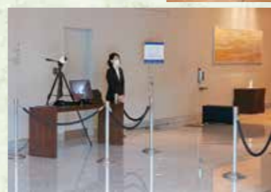
万全な感染対策の下で開催