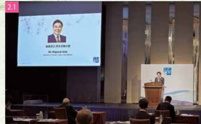
2.1 厚生労働省の挨拶