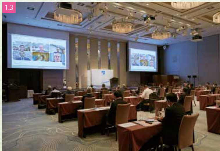
1.3 IFPW各地域代表理事によるパネルディスカッション