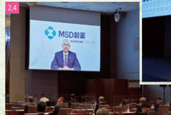
2.4 基調講演を行うMSDのタトル代表取締役社長