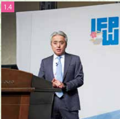
1.4 基調講演を行う武田薬品工業の岩崎代表取締役日本管掌