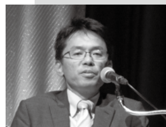
基調講演・林課長