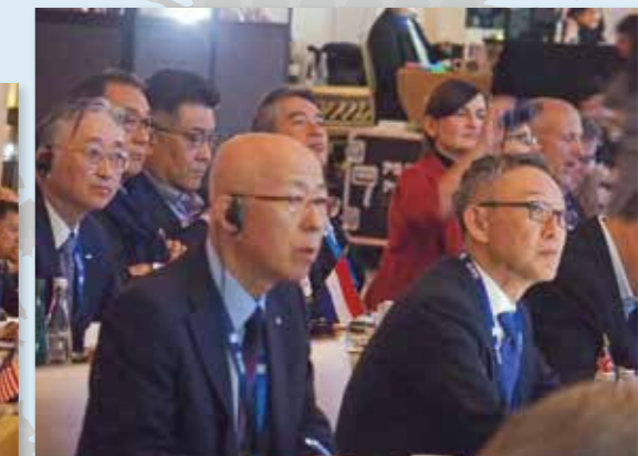
ビジネスセッションを聴講する参加者