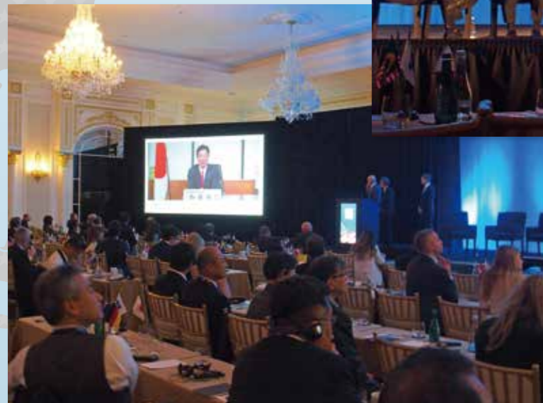
次回開催の東京総会のプロモーションビデオを上映