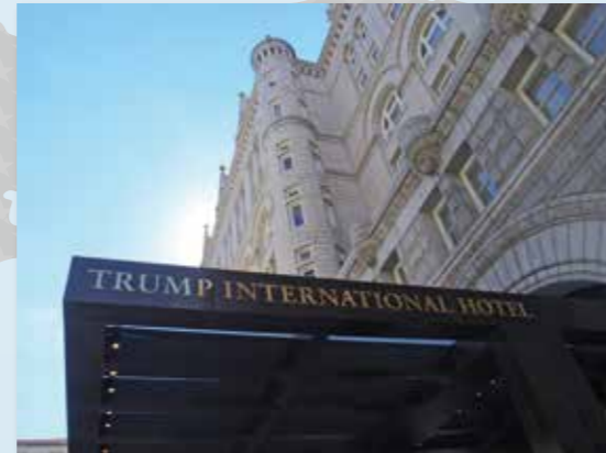
会場となったトランプ インターナショナル ホテル