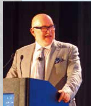
開会挨拶を行うコリスIFPW会長