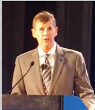
開会挨拶を行うパリッシュ IFPW代表

The important roles of pharmaceutical wholesalers and distributors.