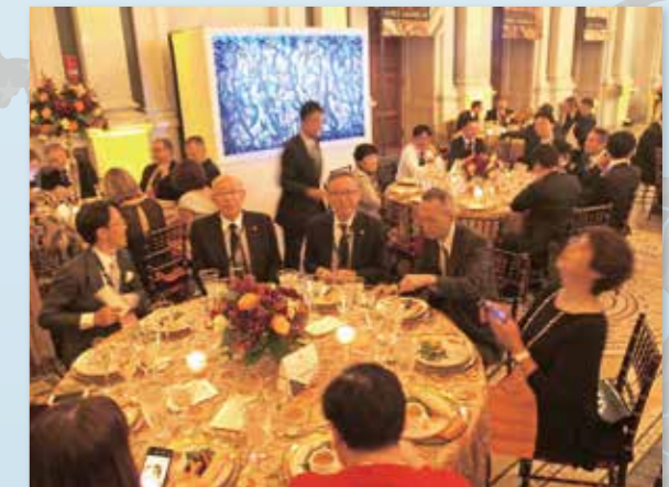
ガラディナーで交流する参加者