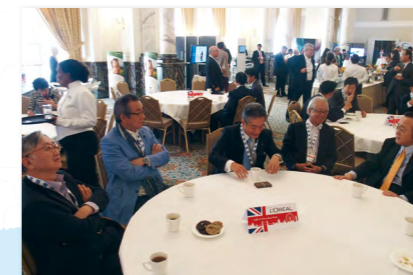
休憩時間に歓談する参加者