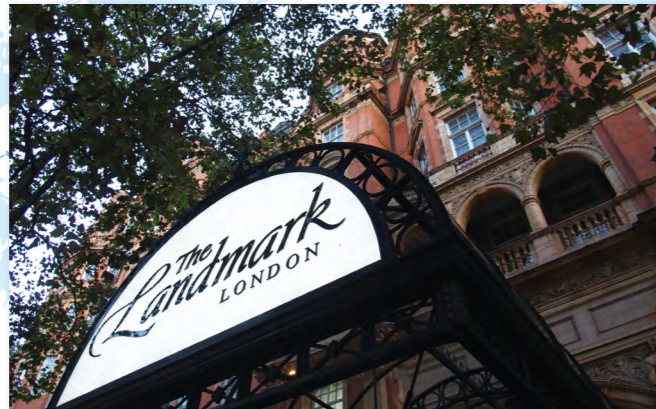
会場となったランドマークホテル