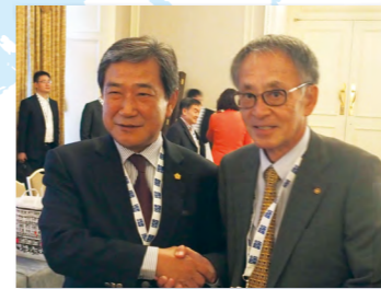
鈴木会長と韓国、中国の代表