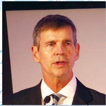
開会挨拶をするパリッシュ IFPW代表