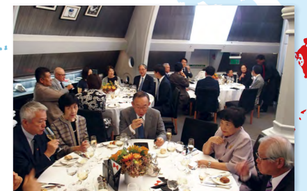
結団式で交流する参加者