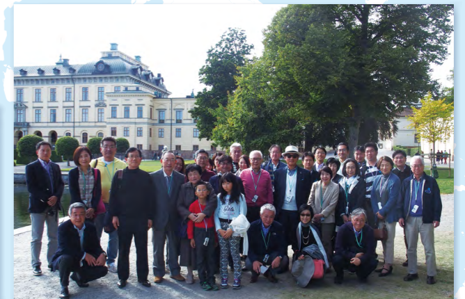
ストックホルムの王宮前での記念撮影