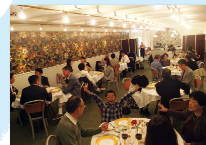
ストックホルムの市庁舎での食事