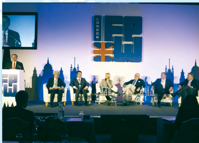
IFPW理事によるパネルディスカッション