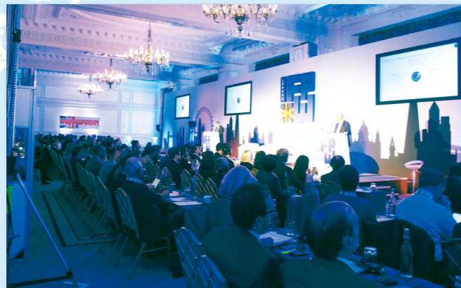
講演などのプログラムが進行した会場