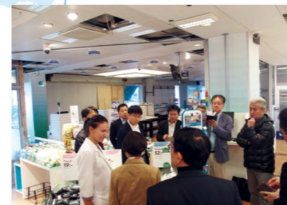
ストックホルムの国営薬局アポテックを視察