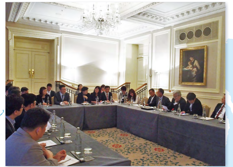
アジア・パシフィック医薬品流通フォーラム代表者会議